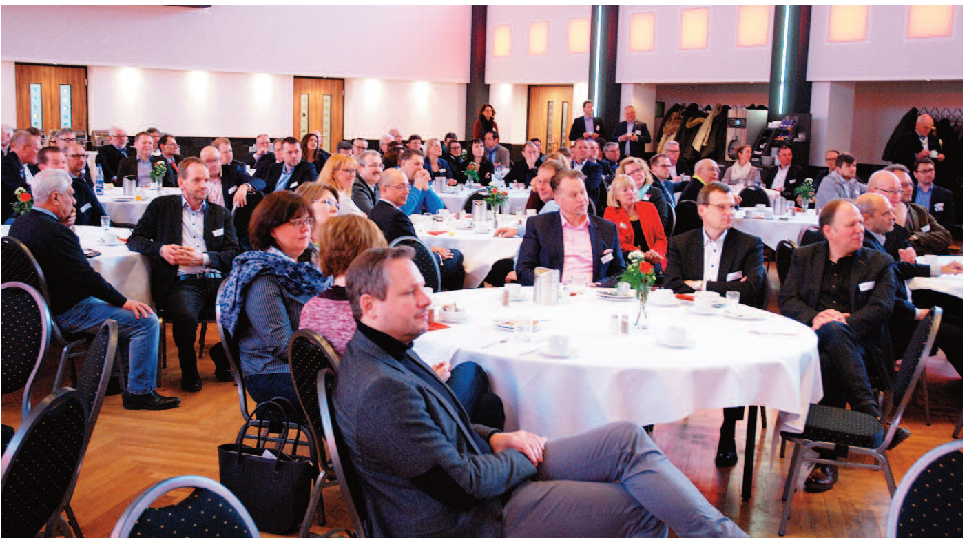
Interessierte Zuhörer – die PHR-Mitglieder und ihre Gäste im großen Veranstaltungssaal.