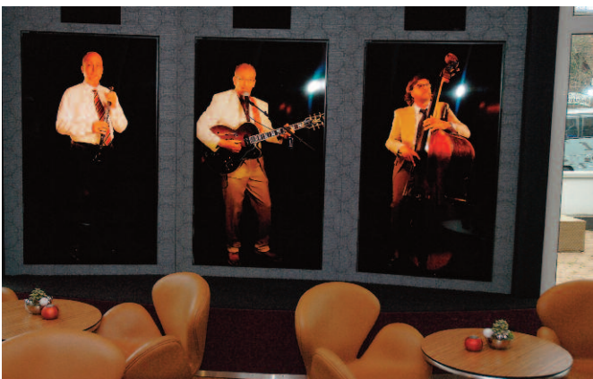
Im Wienecke XI. groß geschrieben werden die Themen Digitalisierung, Virtualität und Entertainment. Beispielsweise gibt es Monitore mit Musikern – man fühlt sich wie auf einem Privatkonzert.